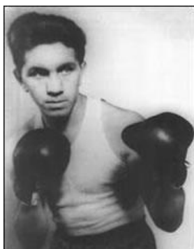
Pierwszy polski złoty medalista w boksie Zygmunt Chychła

4. Ile i jakie medale zdobył na igrzyskach w Helsinkach Emil Zatopek ?