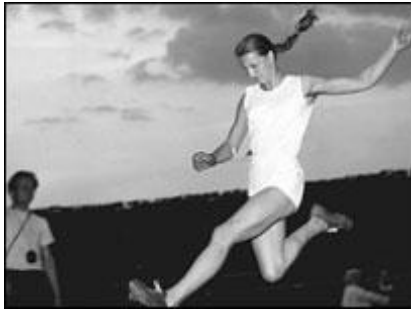
Złota medalistka medalistka w skoku w dal Elżbieta Krzesińska – Duńska

6. Kto zdobył dla Polski dwa medale podczas igrzysk w Melbourne?