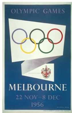
Oficjalny plakat igrzysk w Melbourne