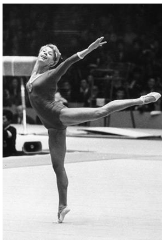
Larysa Łatanina zdobyła najwięcej medali ze wszystkich sportowców na igrzyskach olimpijskich

2. W jakich miesiącach odbyły się XVI letnie igrzyska olimpijskie w Melbourne?