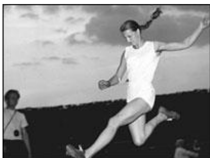
Złota medalistka medalistka w skoku w dal Elżbieta Krzesińska – Duńska

c/ Janusz Sidło – lekkoatletyka ( rzut oszczepem )