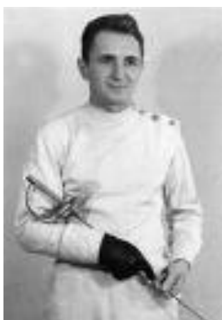
Szermierz Jerzy Pawłowski sumie startował na igrzyskach olimpijskich pięciokrotnie zdobywając 5 medali: 1 złoty w Meksyku, 3 srebrne – 2 w Melbourne, 1 w Rzymie i 1 brązowy w Tokio.