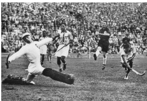
W meczu hokeju na trawie Indie pokonały Niemcy 8:1, źródło:www.olimpic.pl

5. Które miejsce zajęli Polacy w piłce nożnej i piłce koszykowej w Berlinie?