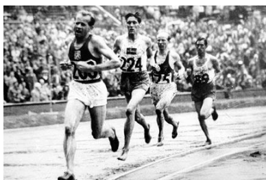
Emil Zatopek Złoty medalista na 5000m i 10000m

16. Jak nazywał się zawodnik, którego nazywano podczas igrzysk w Londynie „czeską lokomotywą”?