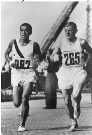
W maratonie zwyciężył Koreańczyk Sohn Kee-Chung startujący jako "Japończyk Kitei Son"

4. W jakich konkurencjach zdobył złote medale Jesse Owens?