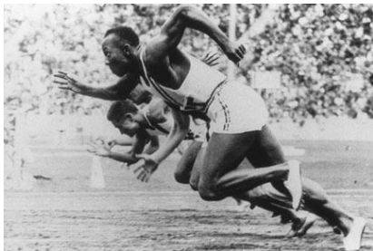
Amerikanin Jesse Owens podczas startu biegu na 100m

2. Kogo nazwano „Czarną błyskawicą” igrzysk w Berlinie?