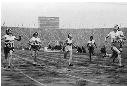
Finisz biegu na 100m wygrywa Holenderka Francina BLANKERS-KOEN

12. W jakich konkurencjach zdobyła złote medale Holenderka F. Blankers – Koen?