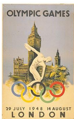
Oficjalny plakat igrzysk w Londynie