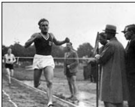
Stanisława Walasiewiczówna mimo, że mieszkała w Stanach Zjednoczonych to startowała w barwach Polski zdobywając złoty medal w biegu na 100m

Janusz Kusociński przełamał hegemonię Finów w biegu na 10 km.