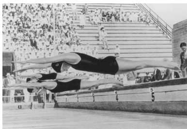
Amerykanka Helene Madison na pierwszym planie podczas startu do wyścigu na 100m stylem dowolnym

7. Trójka najlepszych uczestników X igrzysk olimpijskich w Los Angeles w 1932r.: