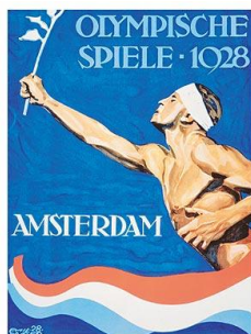
Oficjalny plakat igrzysk w Amsterdamie, źródło: www.olimpijski.pl