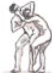
Walka zapaśników

7. Połączeniem jakich dyscyplin sportu był pankration?