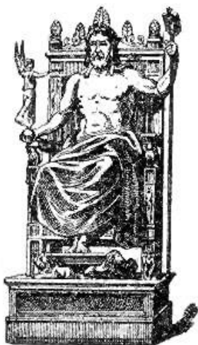
Posąg Zeusa z Olimpii (rycina z pocz. XX w.)