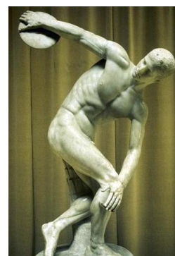
Myron, Dyskobol, marmurowy posąg

Zawodnikami igrzysk mogli być tylko wolni i o nieposzlakowanej opinii obywatele, urodzeni z obojga rodziców Greków. Niewolnicy, heloci, barbarzyńcy, a nawet wolni periojkwowie i metojskowie nie mieli prawa udziału w igrzyskach.