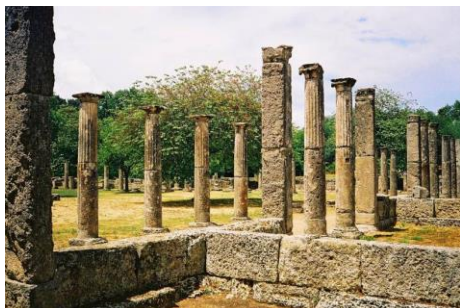
Olimpia – palestra