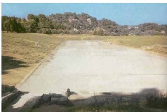
Opis: Olimpia, starożytny stadion, IV w. p.n.e. Autor: Anna Szaleńcowi, źródło:www.portalwiedzy.onet

W jaki sposób i kiedy powstały igrzyska olimpijskie? Wprawdzie za datę pierwszych igrzysk uznano rok 776 przed Chrystusem, nie ulega wątpliwości, że zawody sportowe rozgrywane były już w Grecji na wiele lat przedtem. Świadczą o tym i współczesne odkrycia archeologiczne, i starogreckie legendy. Wszystko przemawia za tym, że Grecy zaczęli organizować sportowe igrzyska u szczytu swego rozwoju, widząc w nich symbol jedności wszystkich swoich plemion. Wiele lat przed rokiem 776 przed Chrystusem królowie Elidy, Pisy i Sparty zawarli święte przymierze poręczając wieczysty sojusz. Przymierze spisali na spiżowym dysku, który został powierzony w opiekę bogini Herze, w jej świątyni w Olimpii. Pokój boży, ekecheiria - ogłaszał Olimpię miejscem świętym, ustanawiał czteroletni okres igrzysk i prawa dla zawodników oraz zobowiązywał wszystkich Hellenów do zaniechania wszelkich sporów i działań wojennych na okres od jednego do trzech miesięcy podczas trwania uroczystości ogólnogreckich. Igrzyska odbywały się w Olimpii (trwających początkowo jeden dzień), mieście na Półwyspie Peloponeskim , co cztery lata, czyli co olimpiadę – pierwszą grecką miarę czasu, zawsze w roku przestępnym.