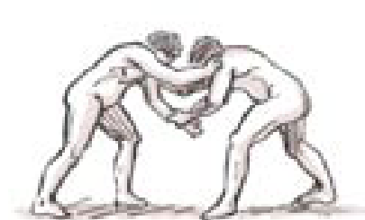
Pankration to połączenie boksu i zapasów