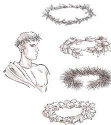
Od góry: wieniec oliwny otrzymywali zwycięzcy igrzysk w Olimpii, wieniec laurowy w Delfach, wieniec piniowy w Koryncie, wieniec wild celery w Nemei, źródło:www.olimpic.org

4. Jaką nagrodę otrzymywali zwycięzcy igrzysk w Olimpii?